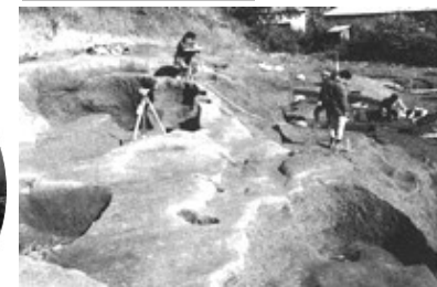
上郷深田遺跡(製鉄遺跡) 古墳時代末期~奈良時代