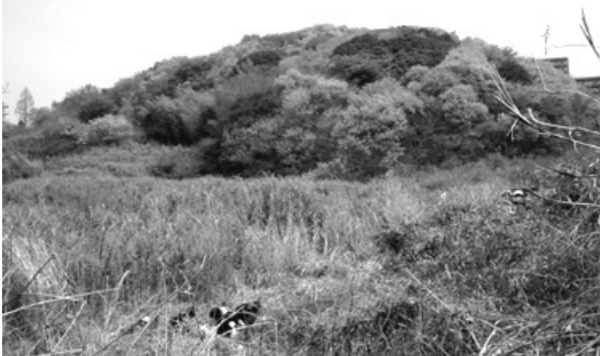
江戸道(古道)が残る西側の山

横浜7大緑地のひとつ、円海山のふもとに広がる瀬上沢。「瀬上市民の森」に連なる瀬上沢にはオオタカやホタルをはじめ豊かな生態系と緑豊かな里山の原風景が残されています なかでもホタルは市内最大の自生地です。多くの人々が力を合わせて、このかけがえのない自然環境や貴重な文化遺産を次の世代に引き継いでいきましょう