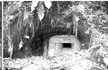
銃眼 昭和の戦争遺跡