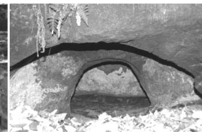
横穴墓(おうけつぼ) 古墳時代~奈良時代 近くには縄文散布地も存在