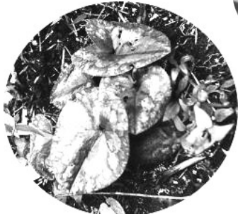
多くの分布が見られます