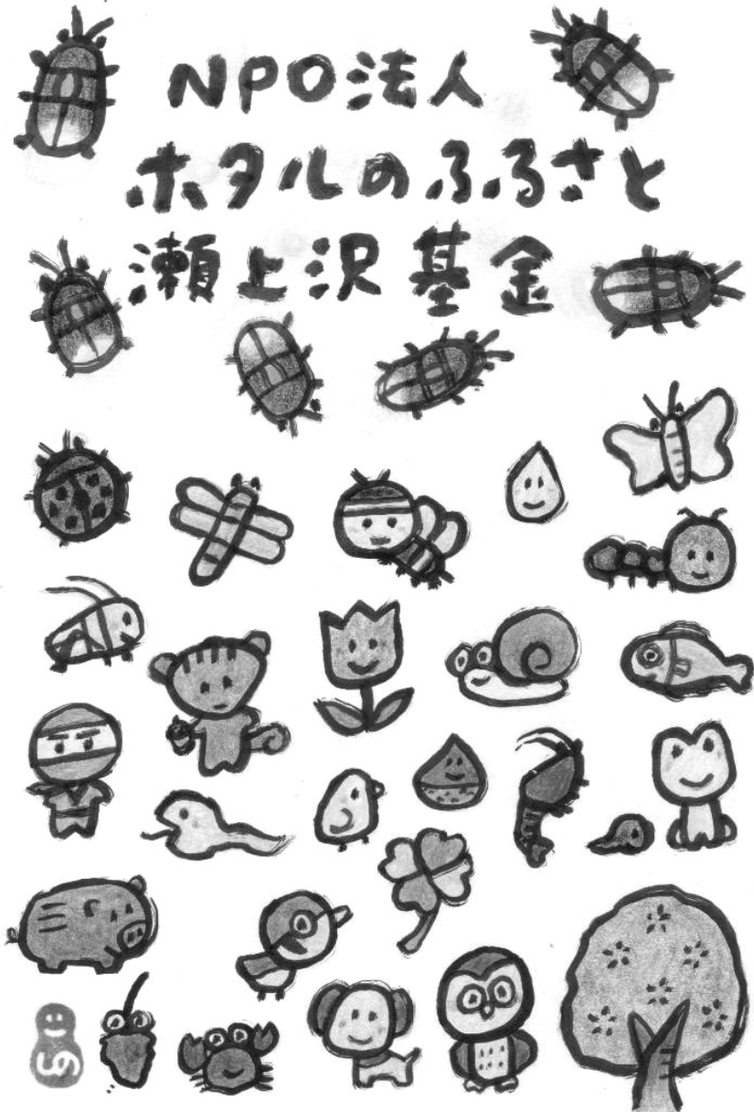
イラスト 篠原 克暢

特定非営利活動法人「ホテルのふるさと瀬上沢基金」 〒234-0054 神奈川県横浜市港南区港南台 9-30-31 Tel 090-6191-1861 Fax 045-832-9167 E-mail segamikikin@gmail.com ホームページ http://www.segamikikin.org/