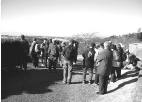
瀬上沢ガイドツアー 毎奇数月の第2日曜日