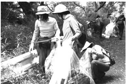
クリーンアップ作戦 毎偶数月の第2日曜日