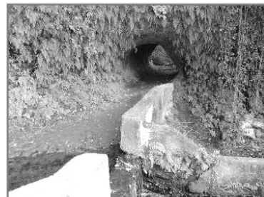
横堰(よこぜき) 江戸時代の農業用水路の堰